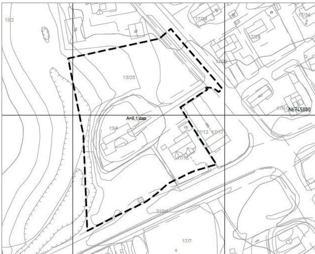
Figur 2- Plangrense for reguleringsendring

Planinitiativ og referat fra oppstartsmøte med kommunen er tilgjengelig på www.envidan.no og på kommunens nettside www.loten.kommune.no .